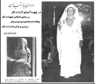
مهر... آیین مهر