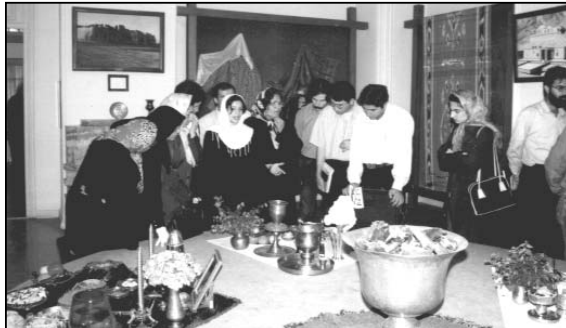
در واپسین نشست کنکاش یگانگی پیشنهاد شد :