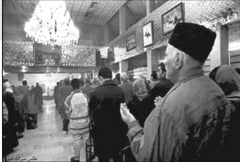
خوب و همچنین مصادف شدن با تعطیلی روز جمعه و همچنین زلزله بم چهارمیا ماثم زده به این مراسم آئینه تجمیع زرتشتیان در آرامگاه قصر فیروزه

بنابر گزارش های رسیده زرتشتیان یزد و کرمان نیز مراسم مشابهی را برای درگذشتگان خویش برپا کردند.